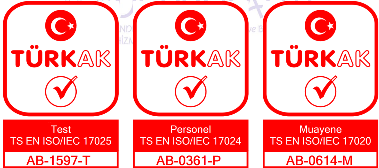
Şekil 6. Laboratuvar Faaliyetleri